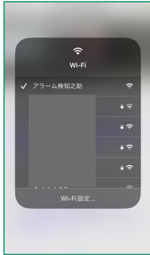
3 本体の設定ボタンを長押し → Wi-Fi設定よりアラーム検知之助を選択